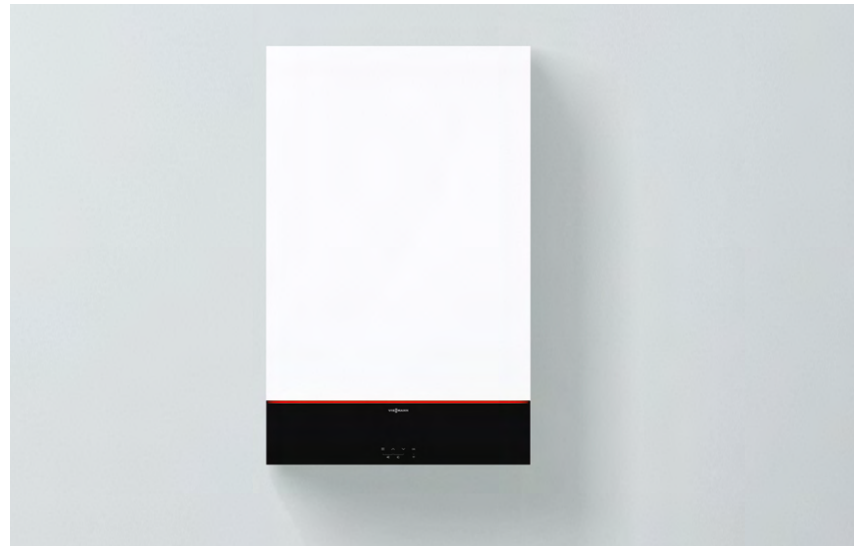
Vitodens 100-W nuovo design e colore Vitopearlwhite

Vitodens 100-W è una caldaia murale a condensazione a gas con un rapporto qualità/prezzo molto interessante. Grazie alla accessibilità frontale di tutti i componenti interni, al peso ridotto e alla silenziosità, si integra facilmente in qualsiasi appartamento e abitazione mono- o bifamiliare. La caldaia è dotata di display LED a 7 segmenti e 4 tasti touch con pannello nero frontale su tutta la larghezza di caldaia. È possibile la gestione di un circuito diretto e/o un circuito miscelato.